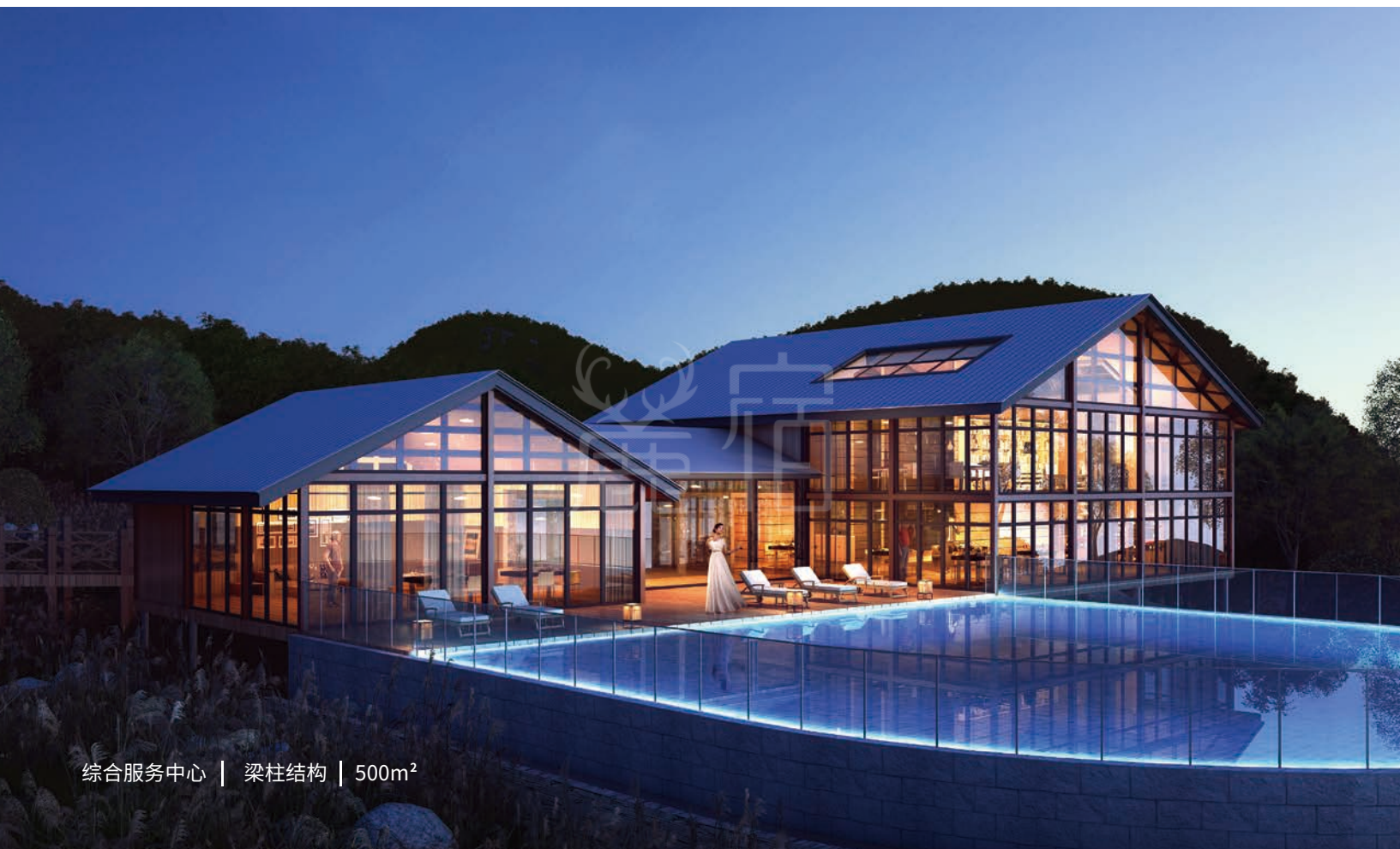
综合服务中心 | 梁柱结构 | 500m 2