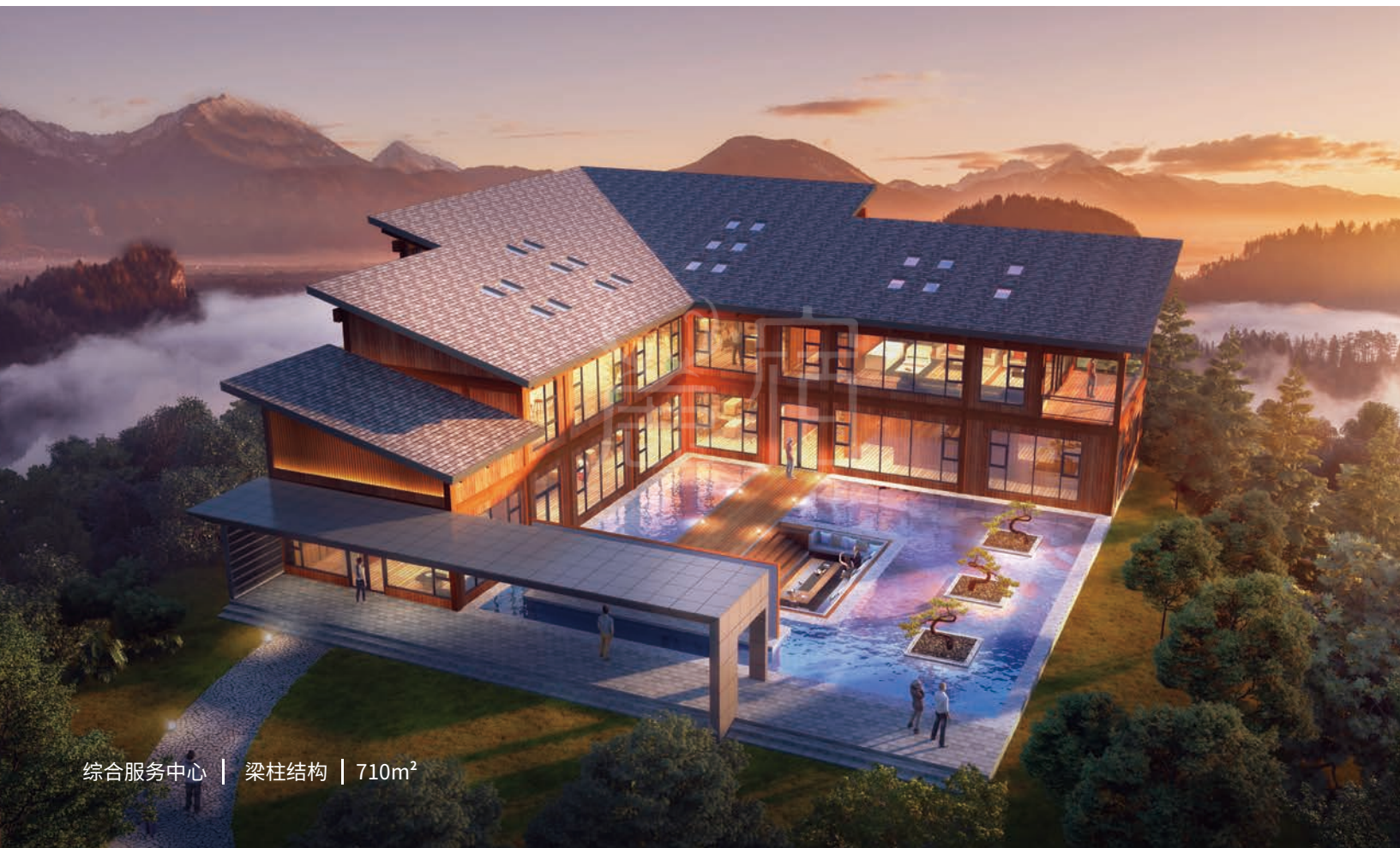
综合服务中心 | 梁柱结构 | 710m 2