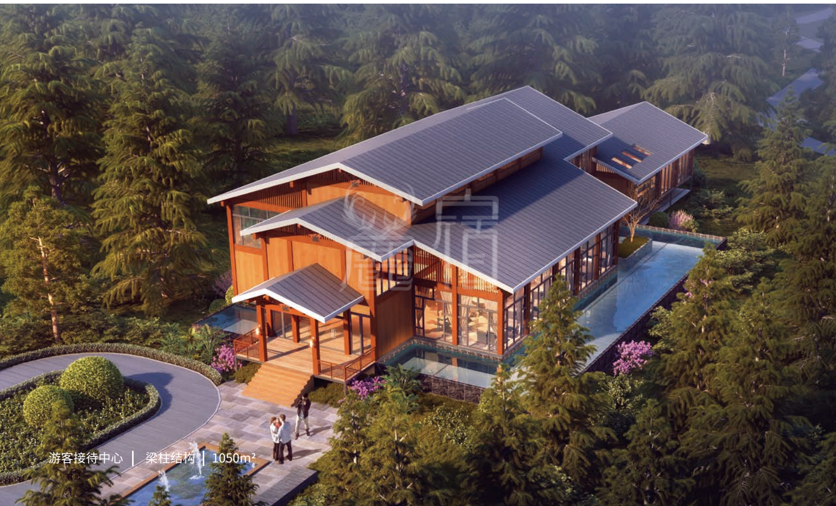
游客接待中心 | 梁柱结构 | 1050m 2