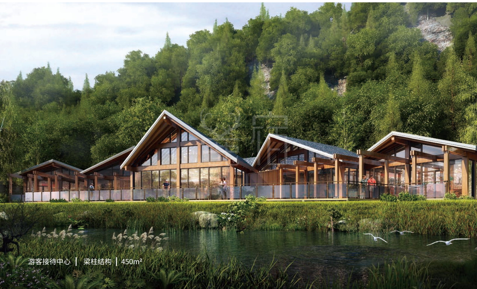
游客接待中心 | 梁柱结构 | 450m 2