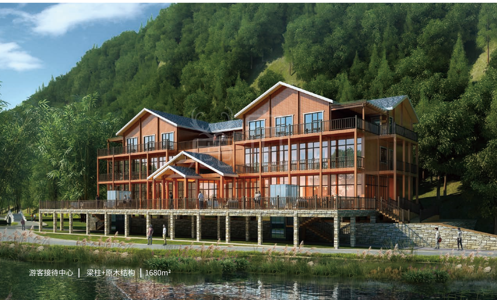
游客接待中心 | 梁柱+原木结构 | 1680m 2