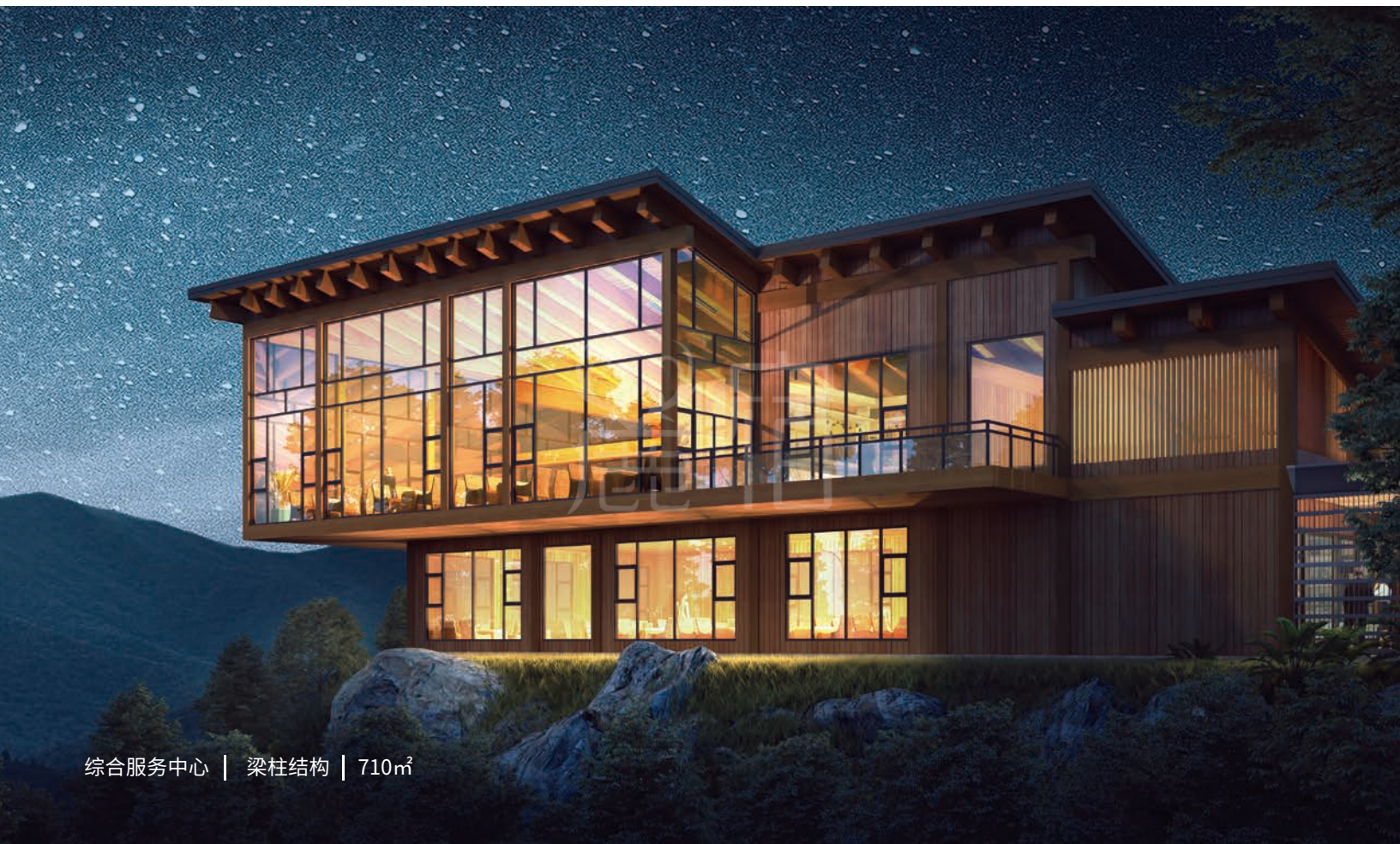
综合服务中心 | 梁柱结构 | 710m 2