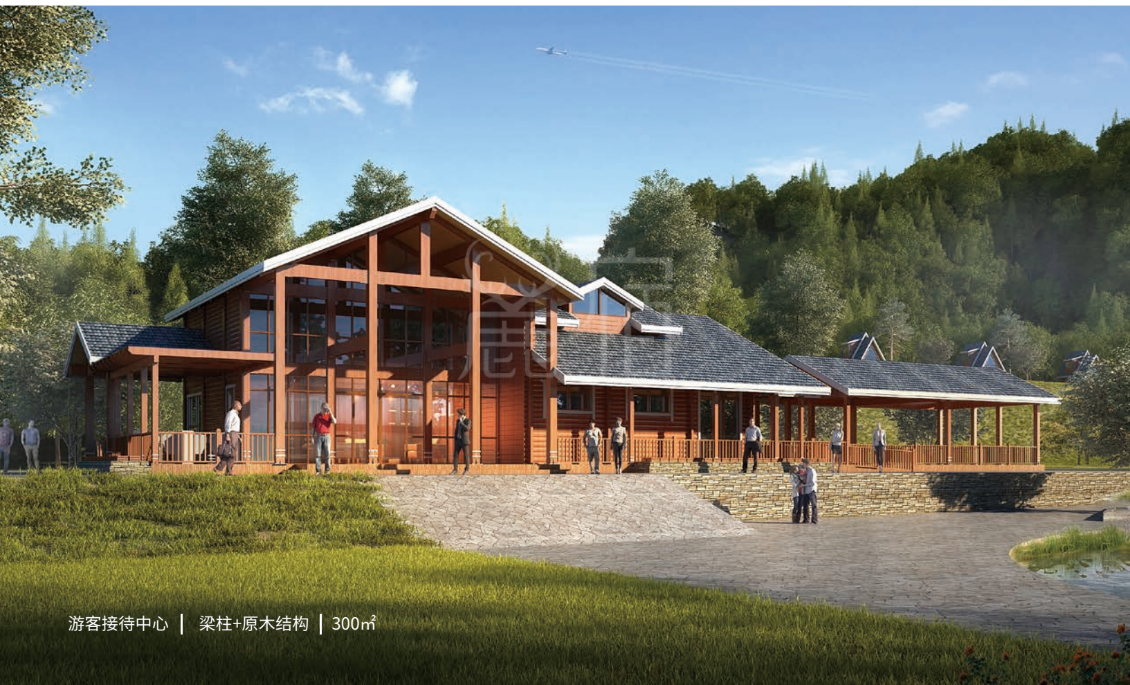
游客接待中心 | 梁柱+原木结构 | 300m 2