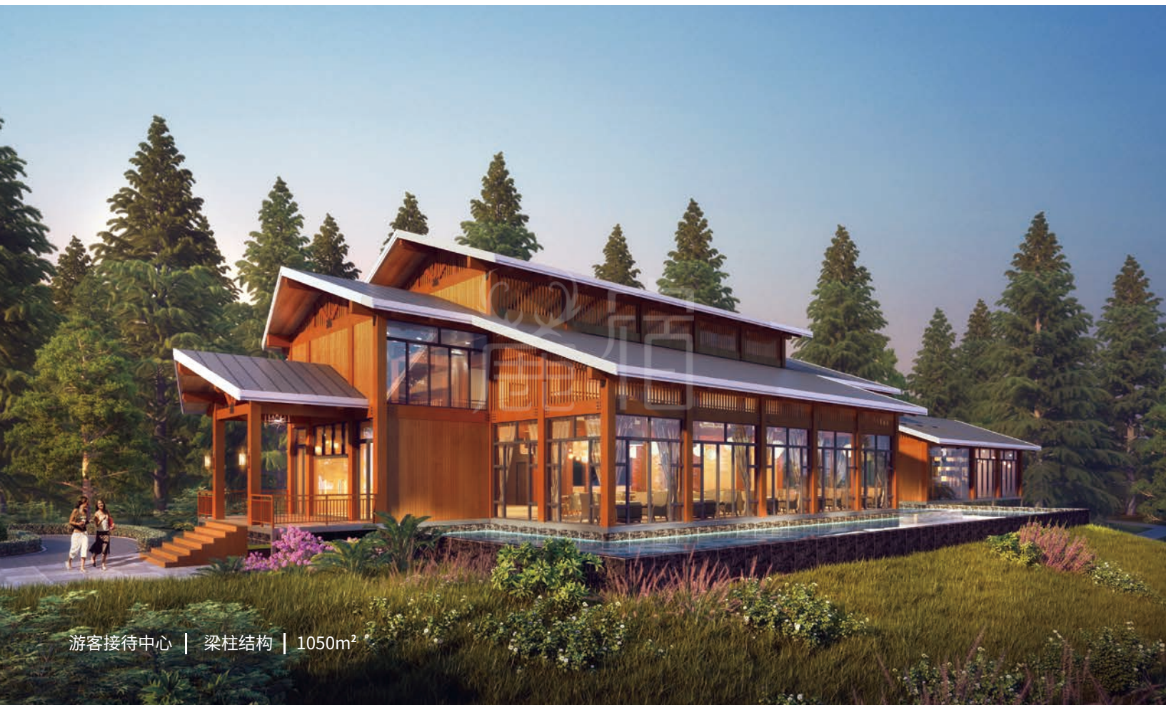
游客接待中心 | 梁柱结构 | 1050m 2